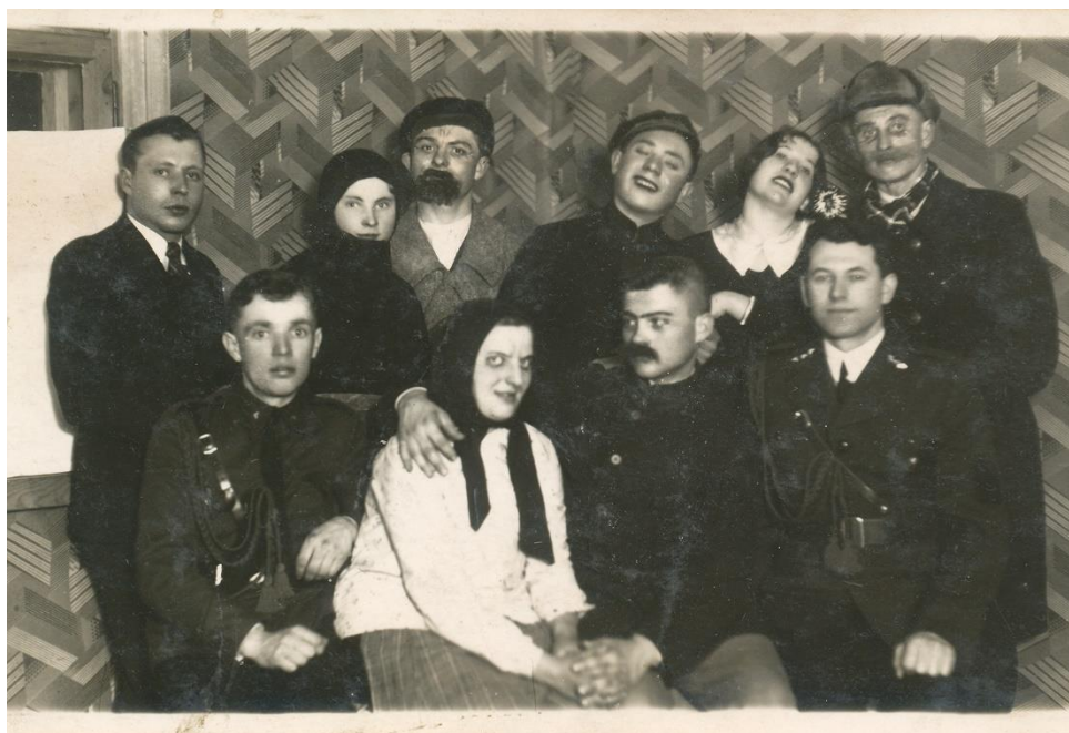
Valstybės radiofonas, Kaunas, 1935–1936 m. Jaunlietuviai pasipuošę kostiumais rengdavo radijo spektaklius.