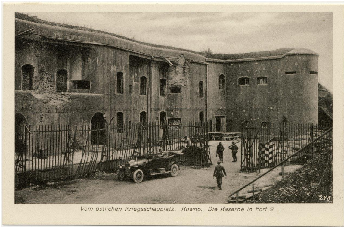
Vom östlichen Kriegsschauplatz. Kowno. Die Kaserne in Fort 9

Kauno tvirtovės IX forto kareivinės, 1915 m. © KDFM (GEK-33546)