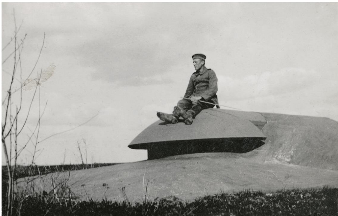
Vokietijos imperijos kareivis sėdi ant A. Arienso sistemos šarvuoto stebėjimo bokštelio, įrengto ant Kauno tvirtovės IX forto kareivinių stogo, 1915–1916 m.

rankoje laikydamas lazdelę. Kareivis vilki 1914 metų pereinamojo modelio švarką „M14 Waffenrock“, avi aulinius 1866 metų modelio batus. Ant kareivio galvos – 1910 metų modelio kareiviška kepurė „Feldmütze M10“ su pilkos spalvos maskuojamąja juostele.