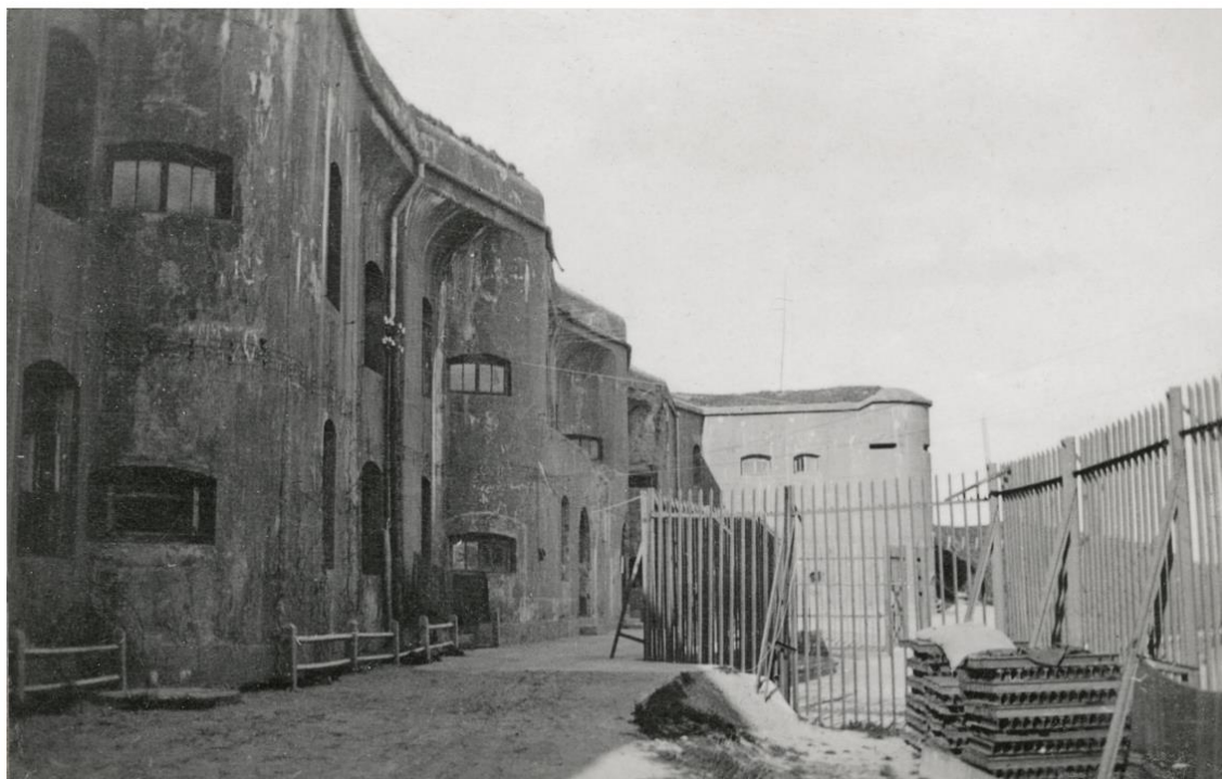
Kauno tvirtovės IX forto kareivinių kiemas, antrame plane – puskaпонieris, 1915–1916 m.

ryšių arba elektros linija. Pabūklų angos su įstiklintais, varstomais langais. Prie pat fasado prisišlijęs elektros arba ryšių stulpas su keraminiais izoliatoriais. Visai šalia forto sienos – žema medinė tvorelė. Prie fasado ant ištiestos virvės pakabintos dvi antklodės. Galima matyti, kad vidinis kiemelis dar ne visai suformuotas, tiesiog suplūktas gruntas. Dešinėje – apsauginės, fortą supusios grotos. Matomas jų tvirtinimas iš vidinės pusės. Šalia grotų į rietuves sukrauti supjaustyti geležinkelio bėgiai, kuriais forto gynėjai planavo uždengti kareivinių langus šturmo metu. Ant bėgių rietuvių padėta pagalvė ir antklodė, šalia ant virvės kabo pilkos spalvos su spalvota juostele kareiviška antklodė. Antrame plane, kaip ir prieš tai buvusioje nuotraukoje, forto puskaпонieris su ant stogo stovinčia antena arba stiebu vėliavai iškelti.