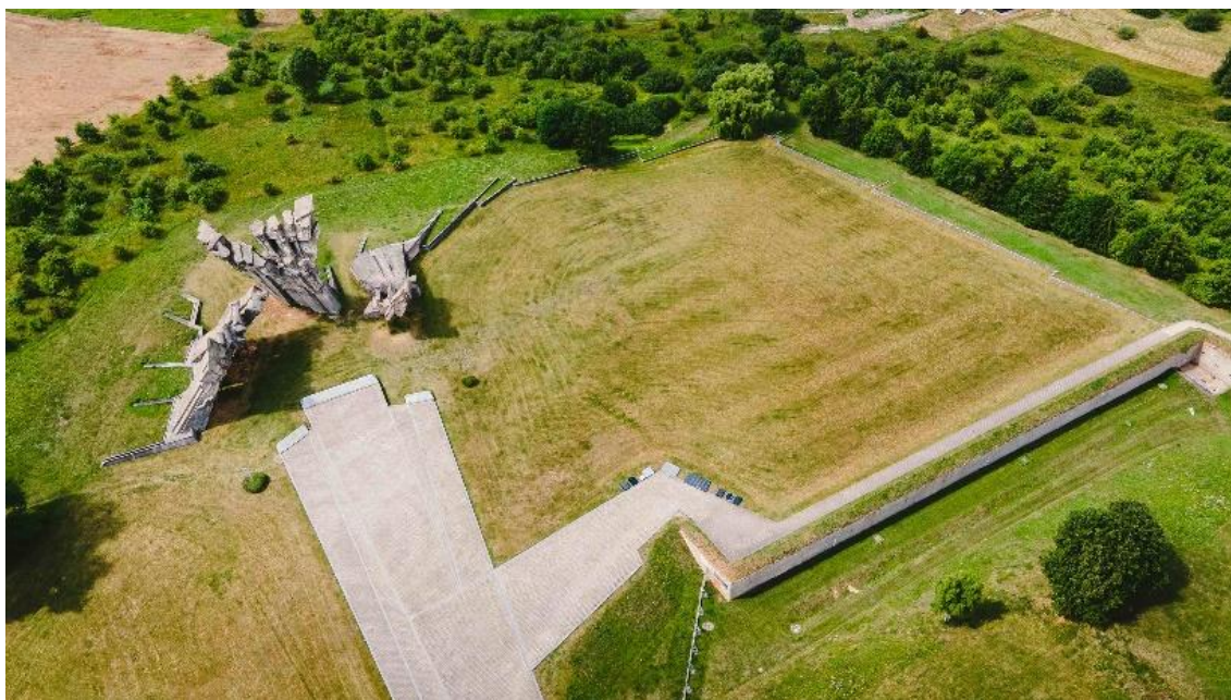
Masinių žudynių vieta prie Kauno IX forto ir monumentas nacizmo aukoms atminti.

vieną naktį liepos viduryje. Į nacių nemalonę jis pateko todėl, kad vengė darbo įrengiant įtvirtinimus. Kaip bausmę, jis praleido parą IX forte ir po to vėl buvo gražintas prie apkasų įrenginėjimo 28 . Taigi nėra patikimų liudininkų, kurie galėtų papasakoti apie tai, kaip atrodė žudynių procesas IX forte.