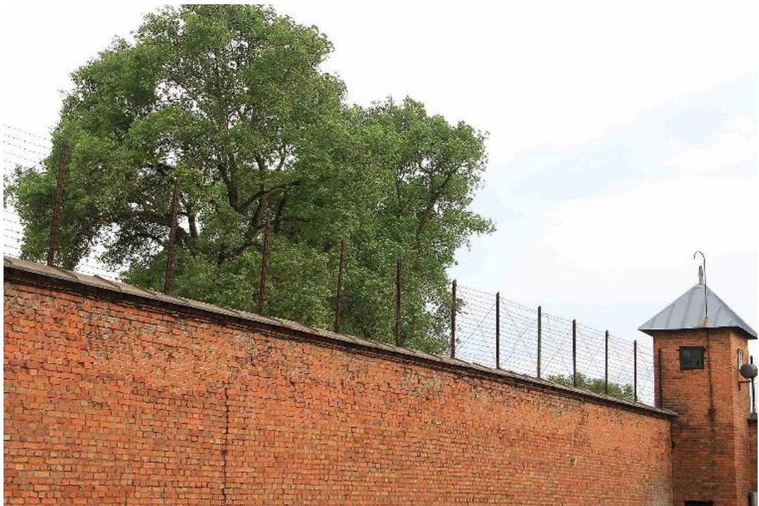
Kauno IX forto siena su spygliuota viela ir sargybinių bokšteliu.

Šiomet gegužės 15 d. sukanka 80 metų nuo to momento, kai iš Prancūzijos Kauno kryptimi pajudėjo konvojus Nr. 73, – tai įvyko 1944 m. gegužės 15 d. Konvojumi buvo vežami 878 žydai, kurių didžioji dalis buvo nužudyta Kauno IX forte ir Pravieniškėse. Iš likusių žmonių, išvežtų į Estiją, tik 23 gyvi sulaukė karo pabaigos. Šiame straipsnyje siekiama atskleisti, kaip konvojus su Prancūzijos žydais pateko į tuo metu nacių okupuotas Lietuvą ir Estiją; taip pat aptariami Holokausto istorijos Prancūzijoje būdingieji bruožai.