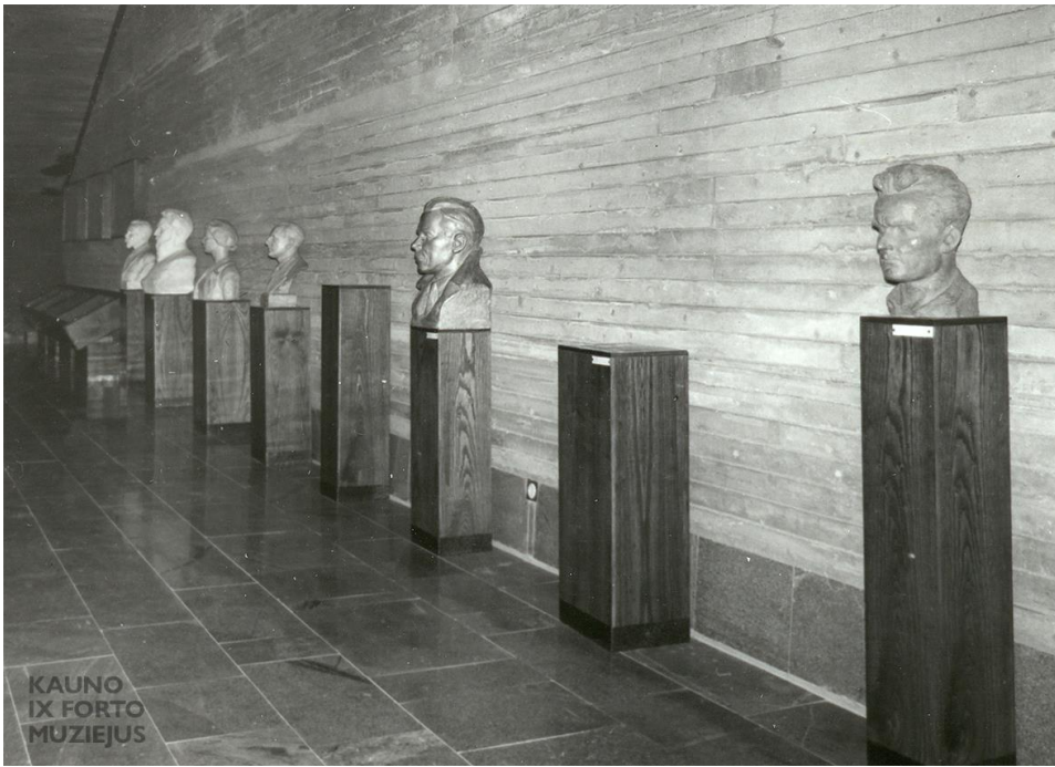
Kauno IX forto muziejaus naujojo ekspozicijų pastato vidaus įrengimo darbų baigiamasis etapas (apie 1983 m.). Komponuojama sovietinės Lietuvos herojų biustų rikiuotė. Pirmasis priešakyje – poeto Vytauto Montvilos biustas