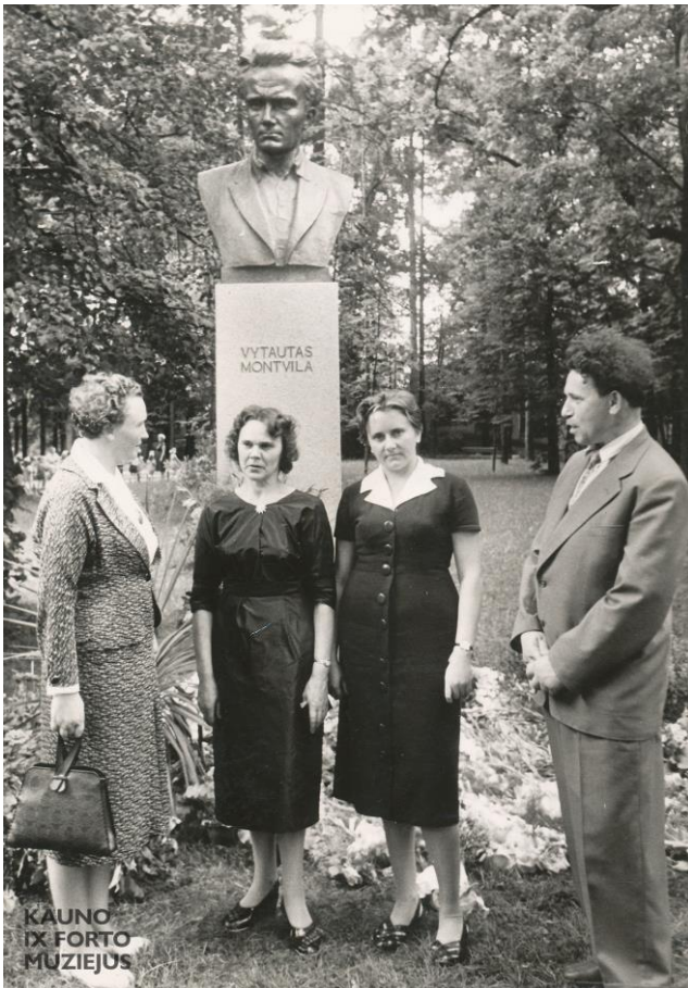
Paminklas poetui Vytautui Montvilai Kaune, Vytauto parke (šalia dabartinės Perkūno alėjos), XX a. 7 deš.