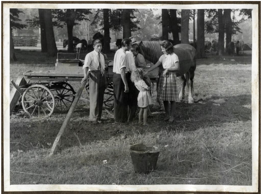
Romai, išgyvenę Aušvico koncentracijos stovyklą, užfiksuoti Straubinge kartu su savo arkliais. Straubingas, Bavarija, Vokietija. 1945–1946 m. Aut. Joseph Eaton. Jungtinių Valstijų Holokausto memorialinio muziejaus nuotr.